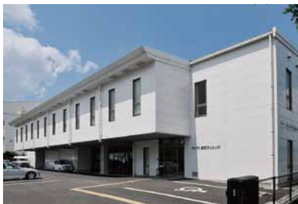
医療法人修腎会 藤崎病院 栄町クリニック