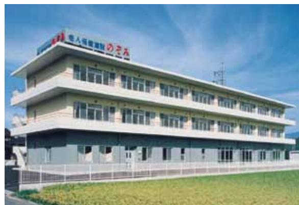
医療法人修腎会 藤崎病院 介護老人保健施設 のぞみ